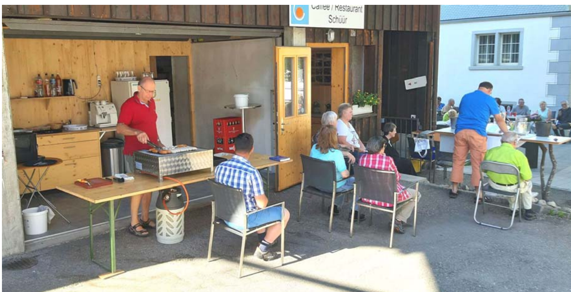
Die Bilder in diesem Booklet wurden die meisten am Openair-Gottesdienst in der Schüür vom 02.Juli 2022 aufgenommen.